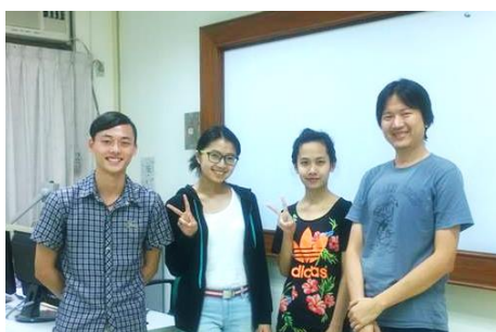
佑竹老師與外籍生們一起合照