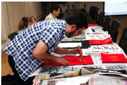
美國學生書法體驗