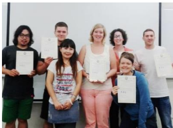
與外師班學員合照