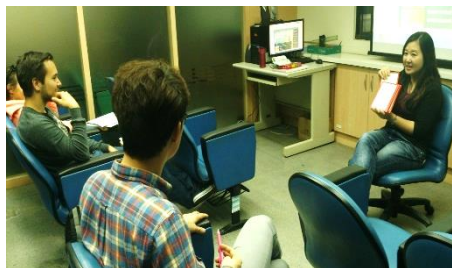
姿文老師進行上課教學的情景