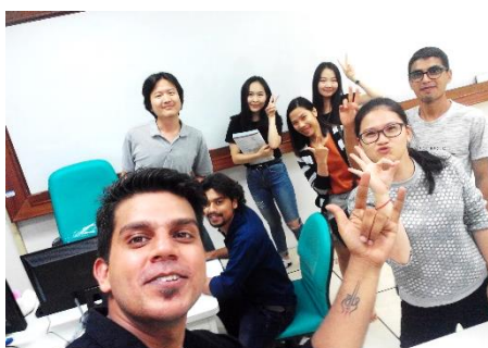
佑竹老師與學生們開心自拍留念