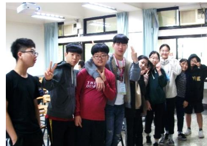
韓國安提阿教會華語課程