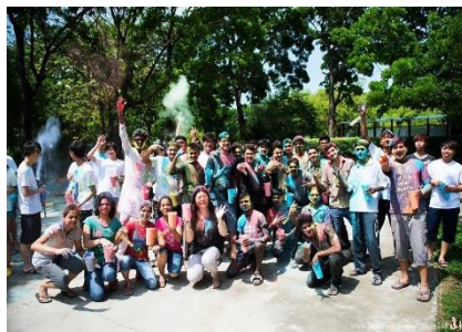
印度 Holi Day 慶祝