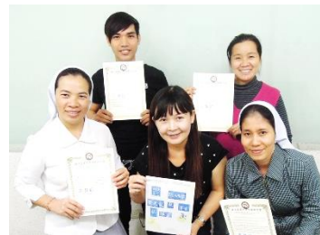
期末與外籍學生合照