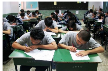
萬能工商東南亞專班華語課